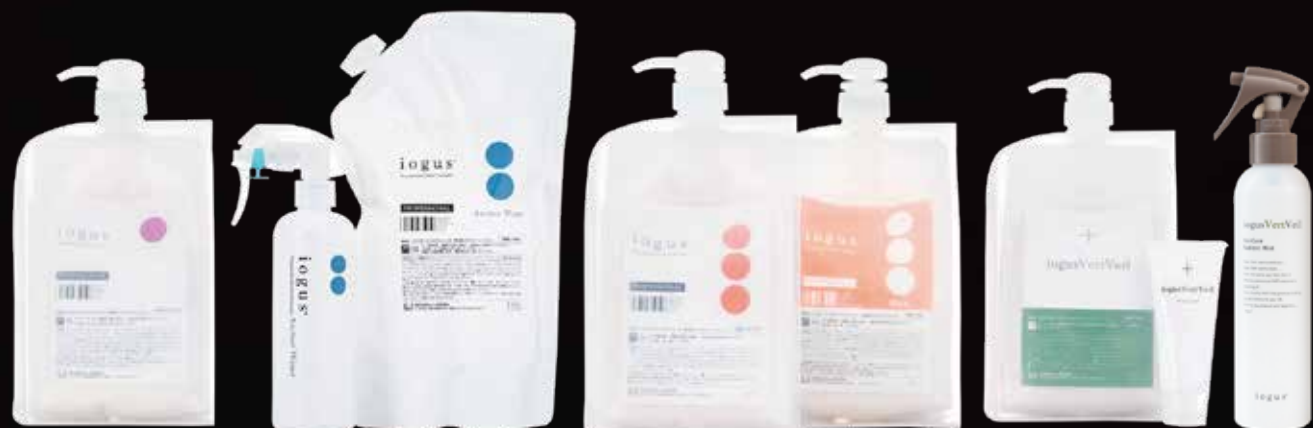
iogustランスダクション01 (業務用)